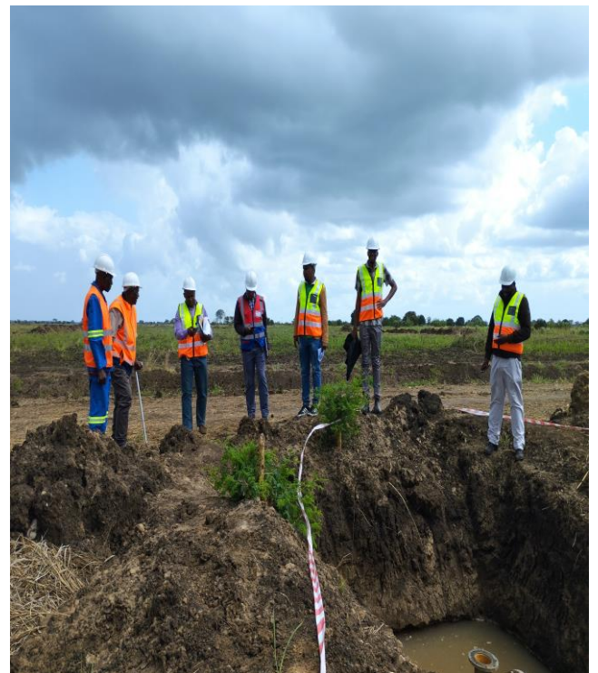
Foto 11: Coordenador do INIR Visita ao campo para a certificação dos Trabalhos