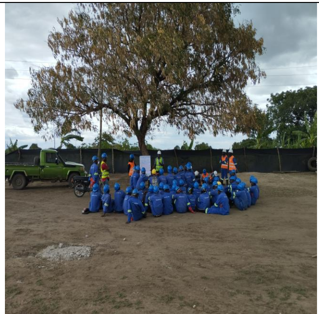
Foto 4: Palestra de VBG/EAS/AS relacionados ao projecto -- Consultor Mazars