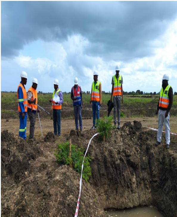
Foto 10: Coordenador do INIR Visita ao campo para a certificação dos Trabalhos